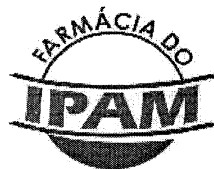
TABELA DE REAJUSTE